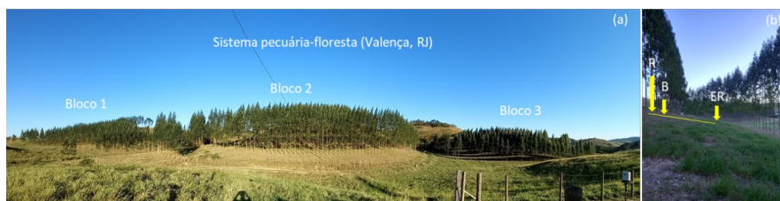
Figura 1. Vista geral do experimento (a) e dos locais de coleta de amostras de solo (R: renque; B: borda e ER: entre renque) - Crédito Fabiano de Carvalho Balieiro, Embrapa Solos.

A coleta de solo se deu nos terços superior, médio e inferior das encostas, em dezembro de 2022 e janeiro de 2023, entre o 35º e 40º meses de idade do plantio, descartando os renques superior e inferior de cada bloco. Em cada terço foram coletadas amostras compostas (3 simples) nas profundidades de 0-10cm, 10-20cm e 20-40cm e em três distâncias dos troncos (renque, borda (cerca de 2,0 m do renque e no entre renque, a cerca de 7,5m de distância dos renques adjacentes) (Figura 1). As amostras foram secas ao ar, peneiradas a 2mm e acondicionadas em sacos plásticos. Para fins de análise química e isotópica as subamostras foram finamente moídas com auxílio de pistilo e gral, até textura de talco. Posteriormente foram encaminhadas para Laboratório de Biotransformação de Carbono e Nitrogênio (LABCEN) da Universidade Federal de Santa Maria (UFSM), Santa Maria/RS para determinação do C total (g kg -1 ) pelo analisador elementar e da abundância natural do 13 C (em ‰). A abundância de 13 C nas amostras de solo é expressa como δ 13 C, que é uma medida que se refere a um padrão expresso em partes por mil: (amostra 13 C/ 12 C - padrão 13 C/ 12 C) δ 13 C (‰) = x 1.000. O padrão internacional é V-PDB (Vienna-Pee Dee Belemite).